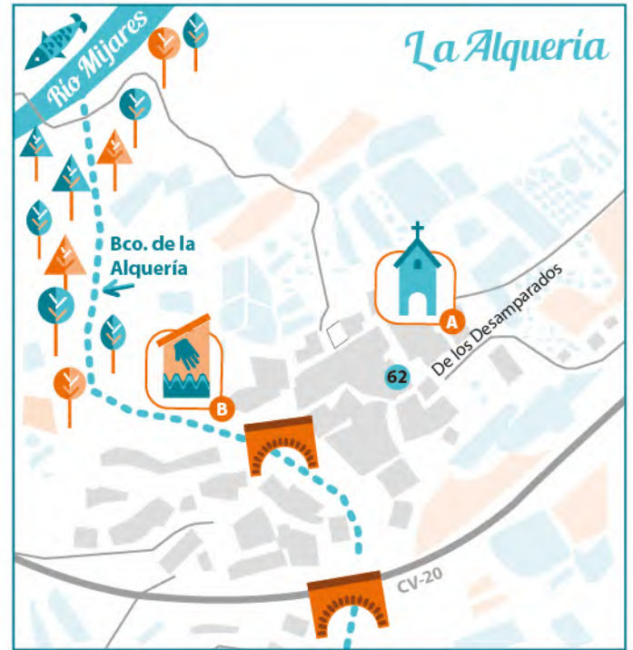
A ERMITA DE LA VIRGEN DE LOS DESAMPARADOS B LAVADERO DE LA ALQUERÍA 62 CERVECERÍA L'ERMITA